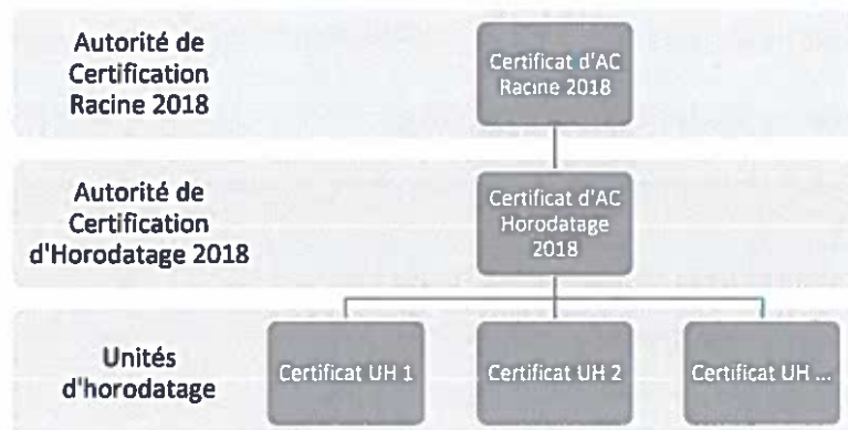
Figure 2 - Périmètre fonctionnel du TSP MediaCert (2/2)